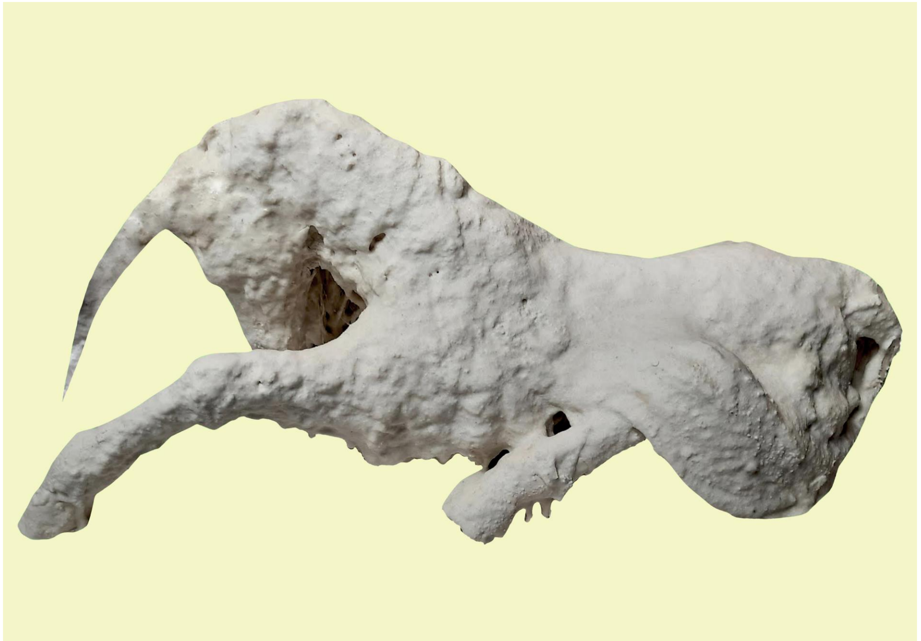
widok z boku / side view