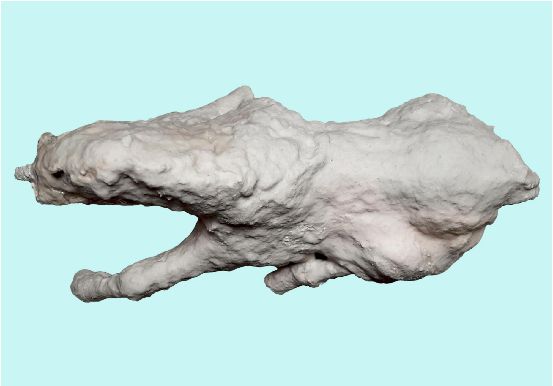
widok z góry / view from above